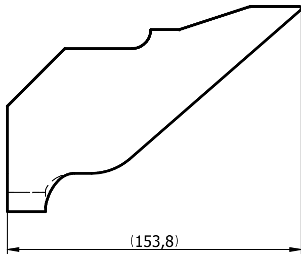
ROZVINUTÝ TVAR Q TVAR SHODNÝ S DXF